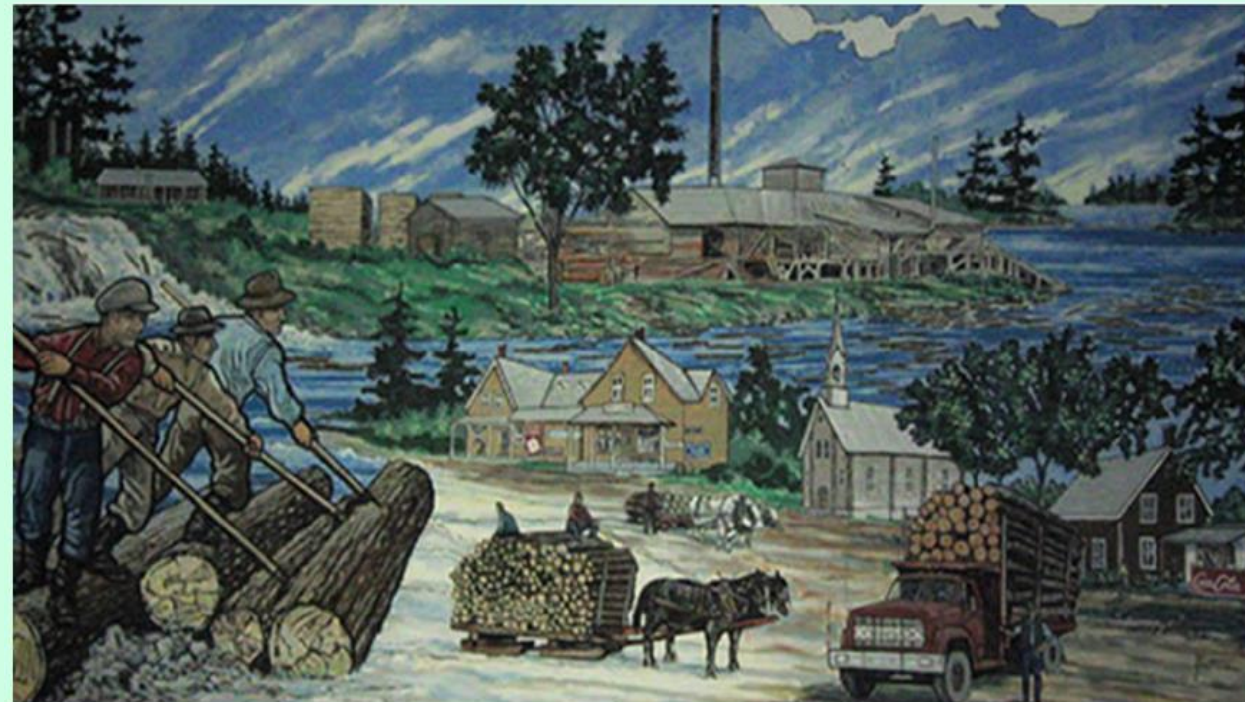
Peint Par/Painted By: Dave Yeatman; An/Year: 2000